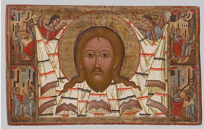
Obrázok 1 Ikona Mandylion

západného maliarstva prezrádzajú niektoré detaily: reliéfny dekor Kristovho nimbu a tiež anjeli, držiaci šatku, ktorí sa v podobnej funkcii objavujú aj na starších gotických sochách a oltárnych tabuliach na východnom Slovensku.